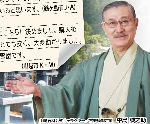
山崎石材公式キャラクター/古美術鑑定家 中島 誠之助