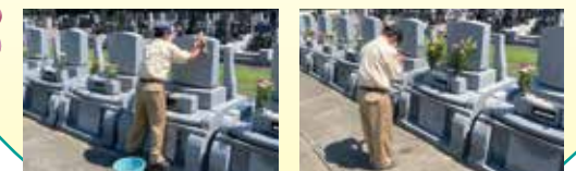
お墓をきれいに掃除 お花をたむけ、しっかりお参り ※写真はイメージです。

■きれいになったお墓を撮影、そのお写真をパソコンや携帯などにメール又は郵送でお送りします。※メールアドレスが必要です。 ■年に12回(毎月1回)の1年代行コースもございます。